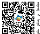
本報官方微信公眾號